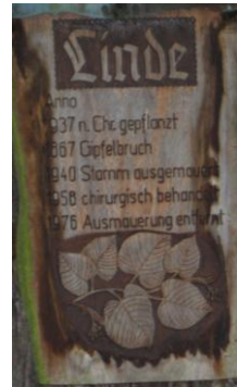
1000-jährige Linde in Schluttenbach

Wer möchte, kann auch noch nach Ettlingen wandern (5,5 km).